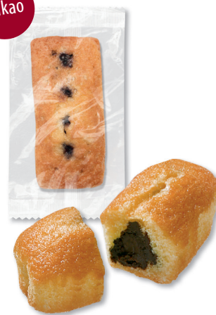
MINI-KUCHEN mit Kakaocremefüllung