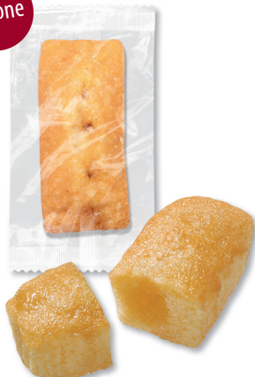
MINI-KUCHEN mit Zitronenfüllung