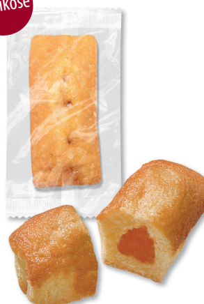
MINI-KUCHEN mit Aprikosenfüllung