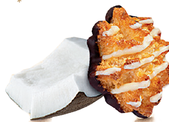
KOKOSMAKRONEN Zartes Kokosgebäck mit Zartbitterschokolade und weißem Dekor