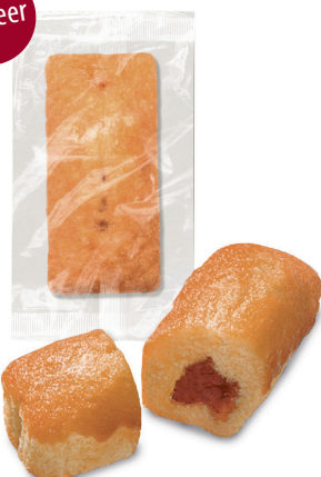
MINI-KUCHEN mit Erdbeerfüllung