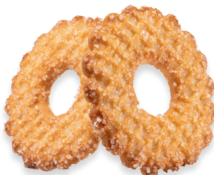
KAFFEEKRÄNZE Klassisches Mürbegebäck mit feinem Hagelzucker bestreut