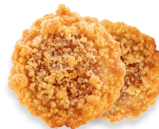
APFEL-STREUSEL-TALER Traditionelles Mürbegebäck mit Apfel-Fruchtfüllung und Streuselüberzug