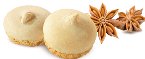
ANIS-GEBÄCK Feines Biskuitgebäck