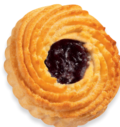
MINI-OCSENAUGEN Zartes Mürbegebäck nach Konditor-Art mit Persipan und einer erfrischenden Kirschfüllung