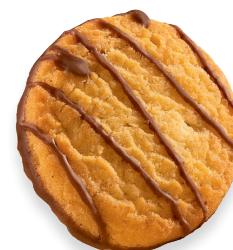
ORANGEN-TALER Zartes Mürbegebäck mit feinem Orangengeschmack, dekoriert und unterzogen von Vollmilchschokolade