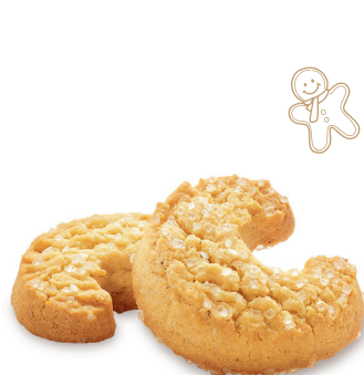
VANILLE-KIPFERL Traditionelles Mürbegebäck mit Vanilleschmack