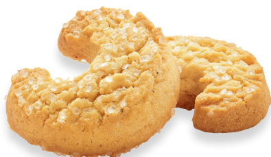
VANILLE-KIPFERL Traditionelles Mürbegebäck mit Vanille verfeinert