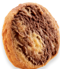
MARMORTALER Klassisches marmoriertes Mürbegebäck